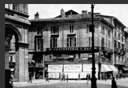
La Confetteria Baj, in Piazza del Duomo, ove oggi sorge il Cinema Odeon [scarica jpg]