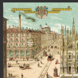
La Confetteria Baj, in una stampa del 1885 [scarica jpg]