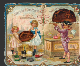
Copertina di un calendarietto promozionale, con catalogo della produzione di Giuseppe Baj [scarica jpg] [scarica psd trasparente]