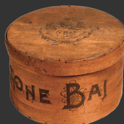
Scatola di legno per la spedizione postale del Panettone Baj da 2 kg [scarica jpg] [scarica psd trasparente]